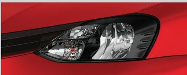
Faros oscurecidos. (1)