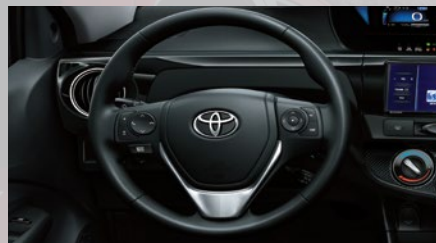
Volante de cuero con control de audio, display de información múltiple y teléfono. (1)