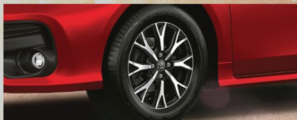
Llantas de aleación diamantadas. (1)