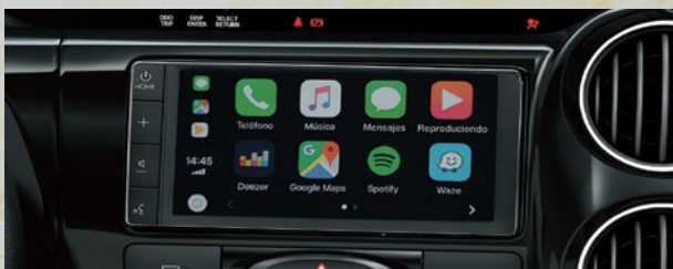
Audio con pantalla táctil de 7" con conectividad: Apple CarPlay® y Android Auto®. (1)(2)