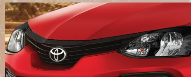
Parrilla con detalle color negro. (1)