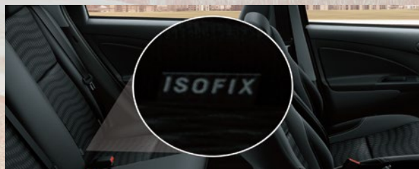
Anclaje ISOFIX (x2) en asiento trasero.