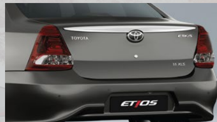
Apertura interior de baúl y tanque de combustible. (4)