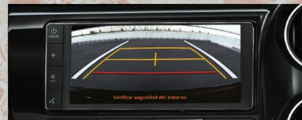
Monitor con cámara de estacionamiento. (1)