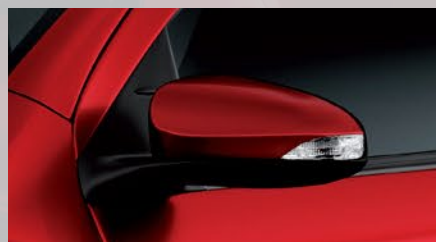
Espejos exteriores con luz de giro incorporada y regulación eléctrica. (1)