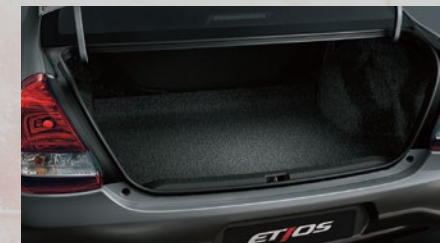
Capacidad de carga de baúl: 562 litros. (4)(5)