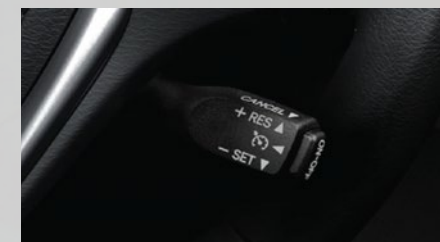
Control de velocidad crucero. (3)