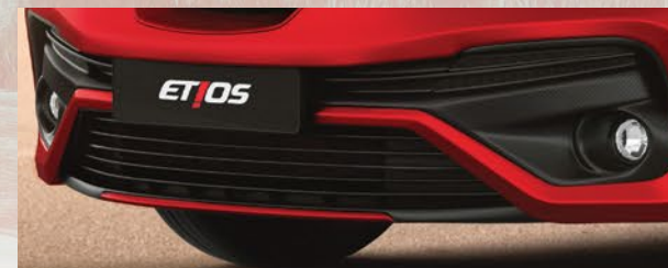
Faros antiniebla delanteros. (1)