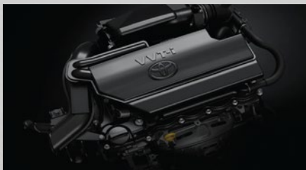
Motor Toyota 2NR-FE, 16 válvulas con sistema dual VVT-i.