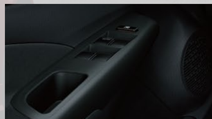
Levantacristales eléctricos en las 4 puertas.