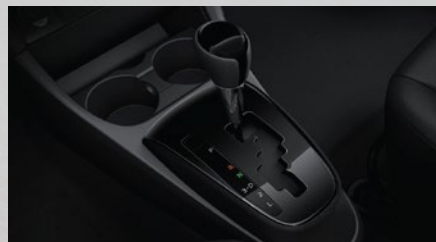
Caja automática de 4 marchas. (3)