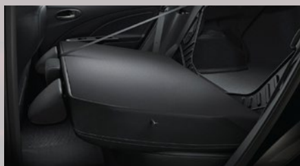
Asiento trasero rebatible.