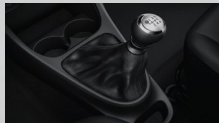
Caja manual de 6 marchas.