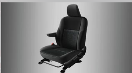
Asiento del conductor con apoyabrazos. (3)