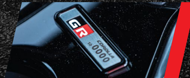
Emblema GR con serial de la unidad