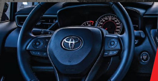
Levas al volante