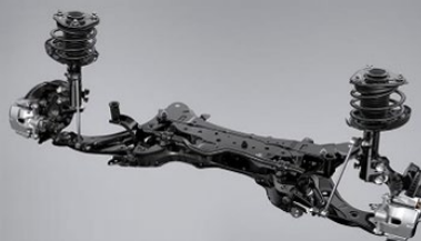
Suspensión deportiva GR