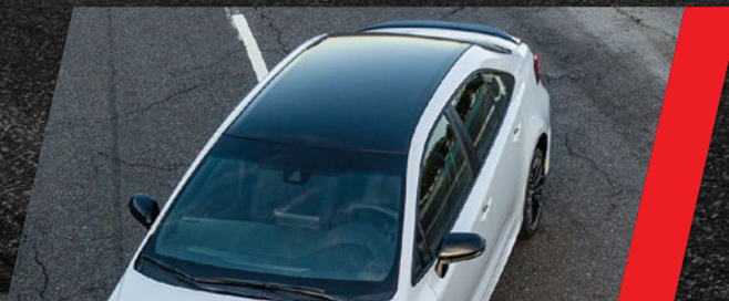
Techo color negro metalizado