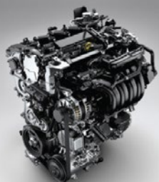
Motor 2.0 Dynamic Force

La suspensión deportiva GR varía la respuesta y la rigidez de los amortiguadores en función del estado del asfalto y el estilo de manejo, que sumado al último motor 2.0 de Corolla, ofrece un confort de marcha excepcional para poder sentir esa emoción al volante que acelera el corazón.