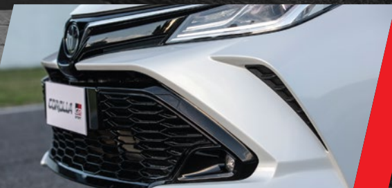
Paragolpes delantero exclusivo con detalles aerodinámicos

Su estética deportiva es el reflejo de la filosofía Gazoo, de compartir y superarnos en cada momento. Por dentro vas a encontrar el confort y la tecnología para enfrentar cualquier obstáculo que se te presente en el camino.