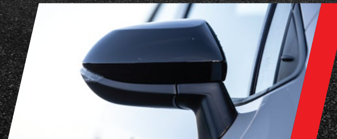
Espejos exteriores color negro