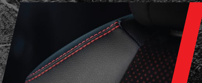
Asientos tapizados de cuero natural y ecológico combinado con Ultrasuede y costuras en rojo