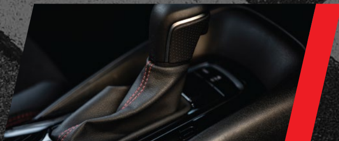
Transmisión automática "Direct Shift CVT"