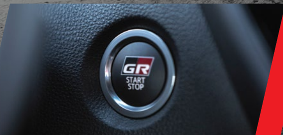
Sistema de encendido por botón con diseño Gazoo Racing