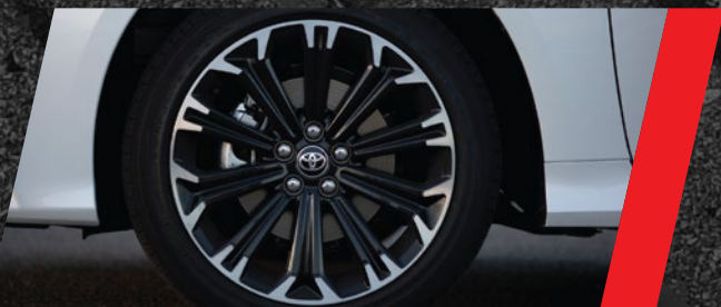
Llantas de aleación 17"