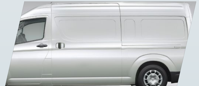
Doble puerta de acceso lateral*