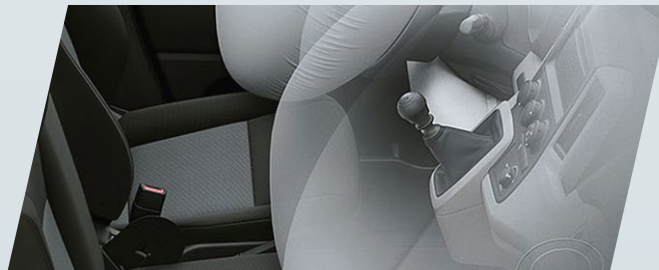
Airbag frontales (x2) con protección para 3 ocupantes