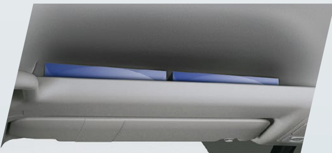
Consola con bandeja superior*