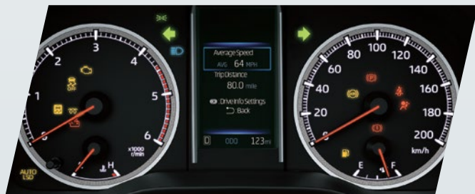
Display de información múltiple con pantalla de color de 4,2" (TFT)