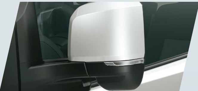
Espejos exteriores de giro angular*