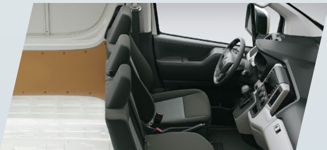
Apoya cabezas delanteros (x3)