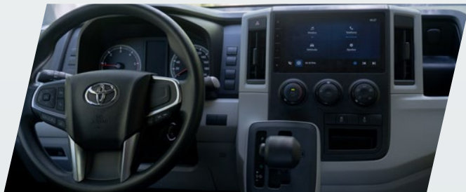
Audio con pantalla táctil, Bluetooth® con manos libres y USB***