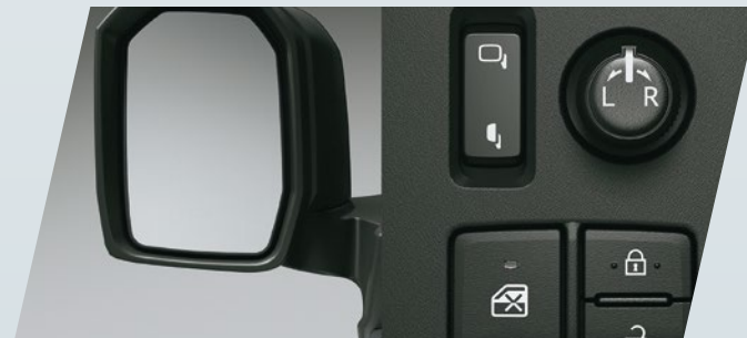
Espejos exteriores con ajuste y plegado eléctrico