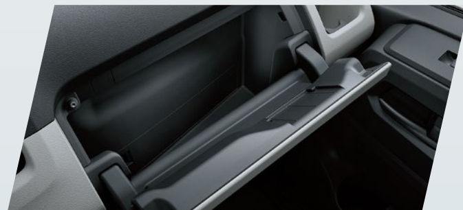
Guantera con llave