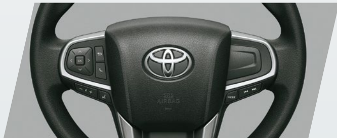
Volante multifunción con control de audio y de teléfono