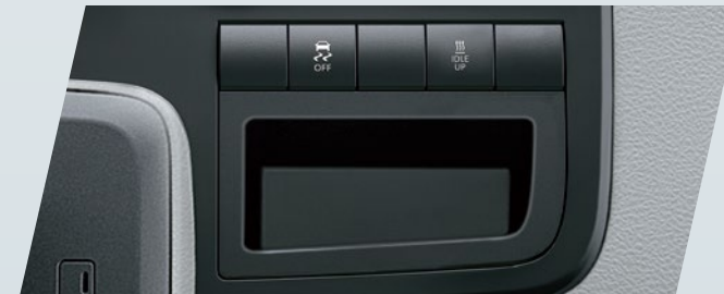
Control de estabilidad (VSC) y Control de tracción (TRC)