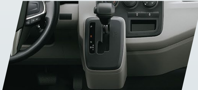
Caja automática de 6 velocidades