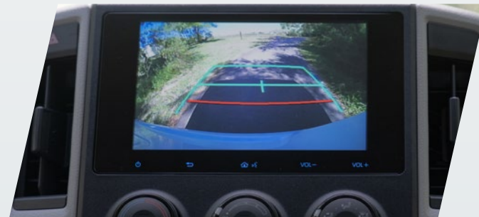
Cámara de retroceso**