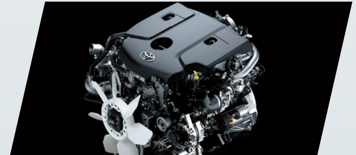
Motor 1GD de 177CV