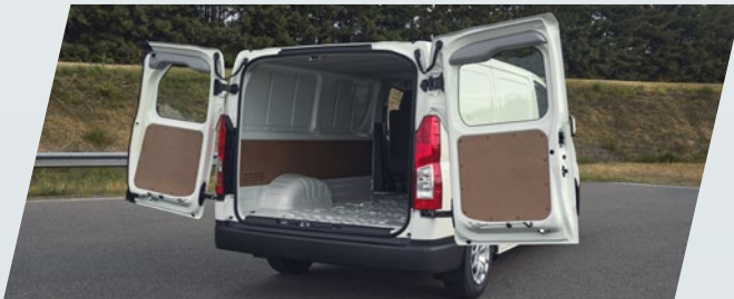
Portón trasero de doble hoja, vidriado, con apertura 90°/180° **

Bienvenido al mundo del confort en el espacio de trabajo eficiente. Bienvenido a Toyota Hiace.