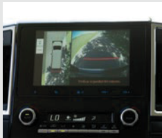
Cámara de retroceso con sistema de visión 360° en pantalla de audio