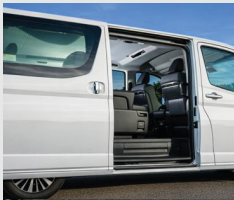
Puertas traseras laterales con apertura eléctrica