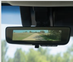
Espejo retrovisor con visión trasera digital