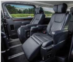
Segunda fila de asientos con regulación eléctrica y calefactados