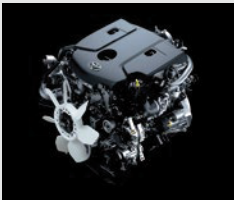
Motor 1GD (2.8l) - 163 CV

*Diésel con contenido de azufre menor a 10 ppm. **Toyota Safety Sense, integra diferentes sistemas de seguridad activa que pueden variar según cada modelo y/o versión. A su vez, estos sistemas están diseñados para asistir al conductor, no para sustituirlo. El conductor debe mantener en todo momento el control de su vehículo y es responsable de su conducción, por cuanto estos sistemas no reemplazan la conducción segura. El correcto funcionamiento del Toyota Safety Sense y de los distintos tipos de sistemas que equipa, depende de muchos factores incluyendo las condiciones del camino, el clima y el vehículo, razón por la cual el/los sistemas podrán verse afectados u obstaculizados debido a factores externos, no siendo Toyota Argentina S.A. responsable de las consecuencias derivadas del uso del sistema. Para más información sobre Toyota Safety Sense, dirigirse a la web toyota.com.ar o consulte el manual de usuario. ***Disponible solo por conexión USB. Verifique la compatibilidad de tu modelo con el fabricante.